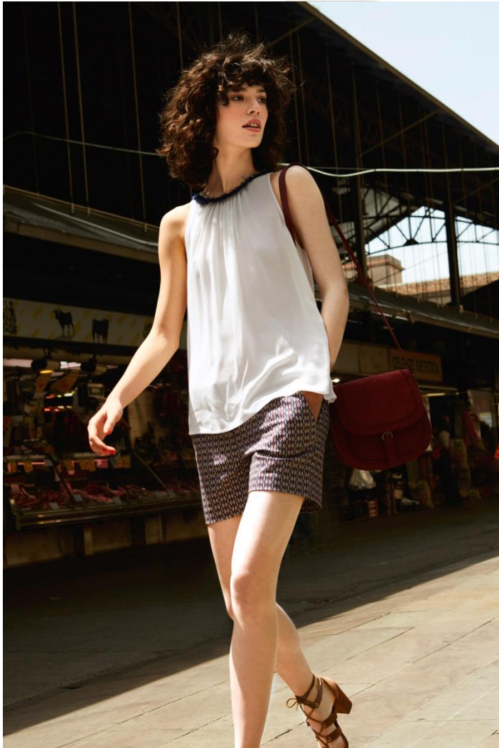
Chemisier • 25.95 € Short • 19.95 € Sac • 29.95 € Chaussures • 39.95 €