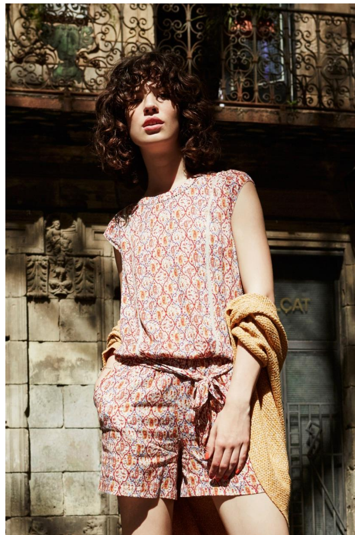
Combishort • 34.95 € Pull • 29.95 €