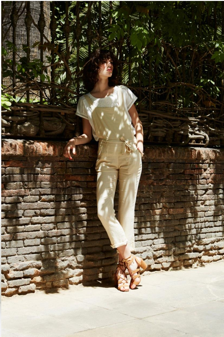
T-shirt • 29.95 € Salopette • 49.95 € Chaussures • 39.95 € Bracelet • 12.95 €