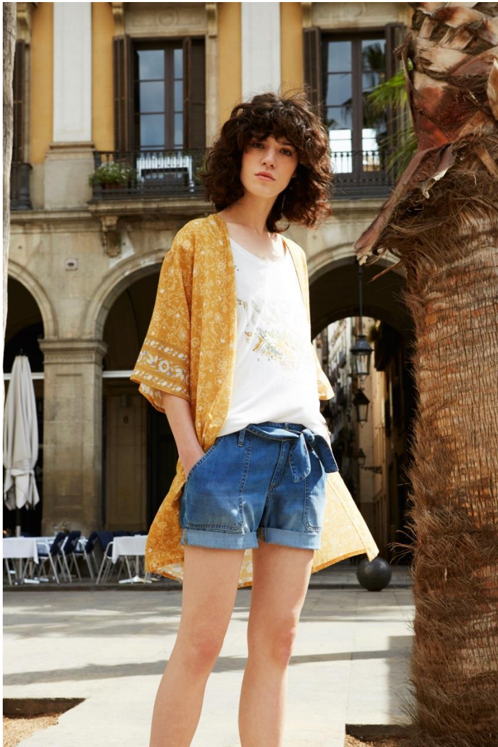
Veste • 34.95 € T-shirt • 12.95 € Short • 25.95 €