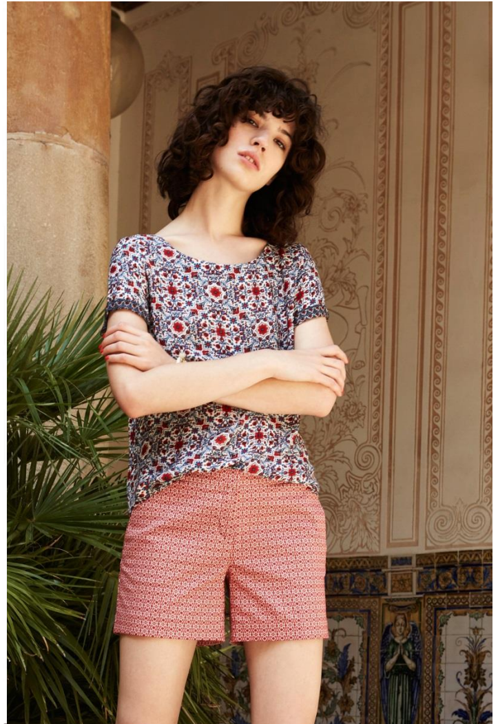
Chemisier • 29.95 € Short • 19.95 €