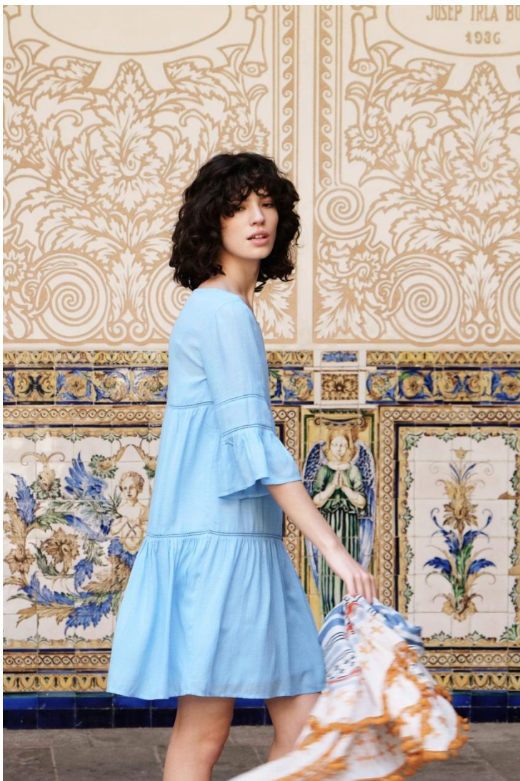
Robe • 39.95 € Foulard • 16.95 €